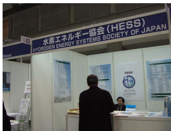
FC EXPO 2007 水素エネルギー協会 ブース