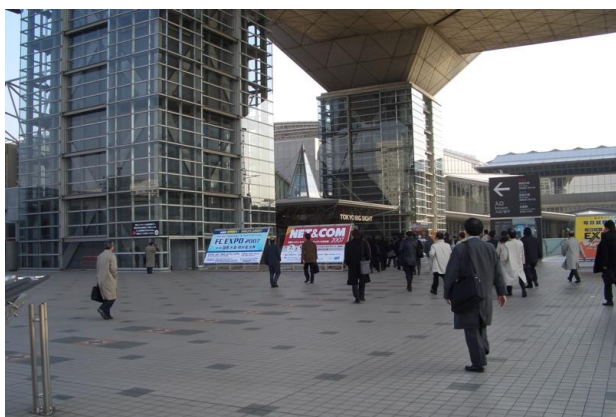
すっかりお馴染みのFC EXPO 入口風景

今回で3回目となるFC EXPO が2007年2月7日から2月9日まで東京ビッグサイトで開催されました。今回も水素エネルギー協会は共催という形でFC EXPO の開催を支援いたしました。年々規模が大きくなるこのFC EXPO ですが今回は出展企業は462社にのぼり、期間中の入場者は2月13日付の国際水素・燃料電池展事務局の発表によると24,494名にもなったそうです。